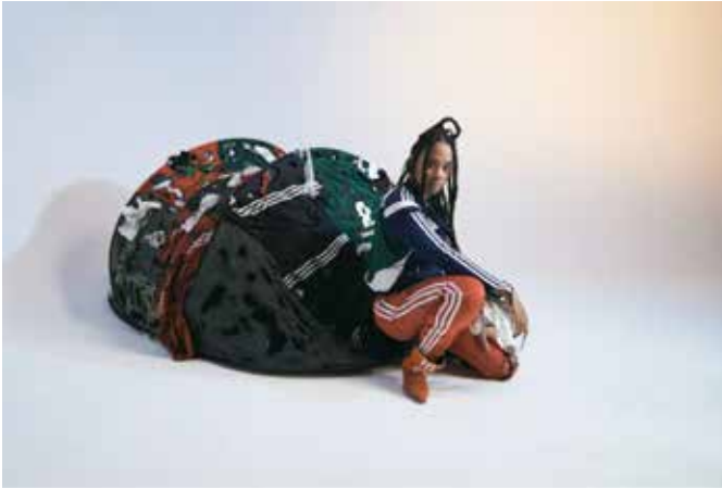
© Threads and Tits / The Yes Men